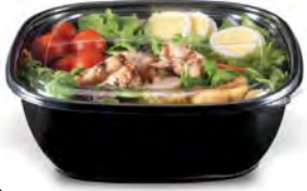
Tray and Box for Food Container