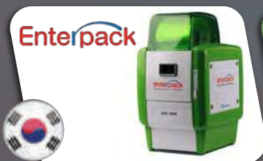
ENTERPACK™ Packaging Set