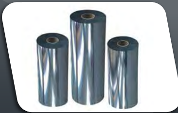
PET/PP Sheet Roll