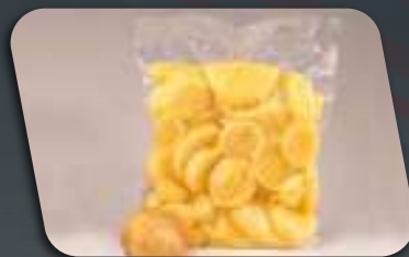
Laminated Bag/ Pouch / Retort