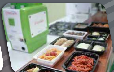
ENTERPACK™ Packaging Set