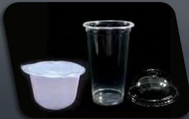
Plastic Cup and Bowl for Beverage