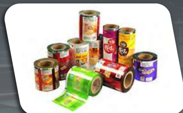
Gravure Print for Label