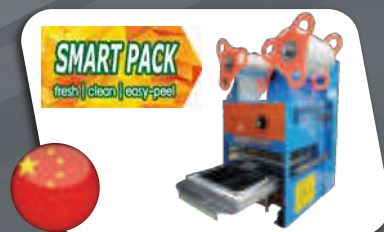
SMART PACK™ Packaging Set